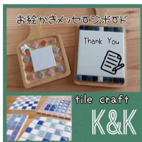
お絵かきメッセージボード Thank You tile craft K&K