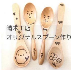
晴木工店 オリジナルスプーン作り